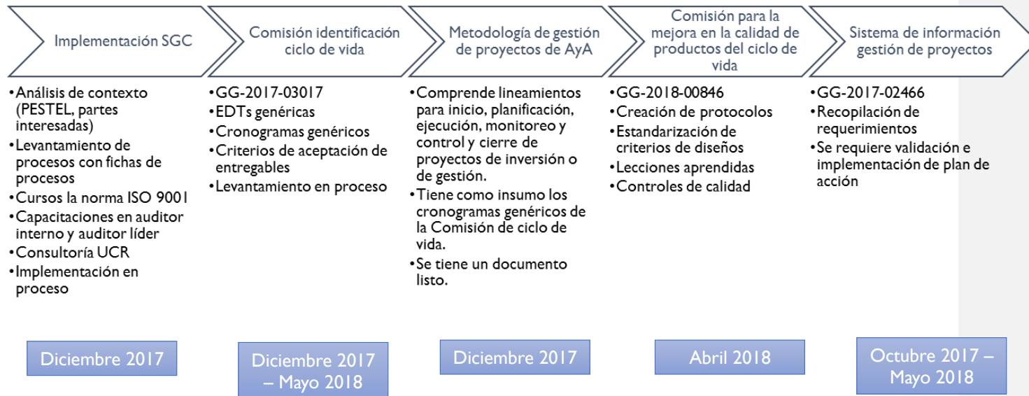
Figura I. Resumen de acciones implementadas respecto al Plan sobre acciones para mejorar la ejecución de inversiones