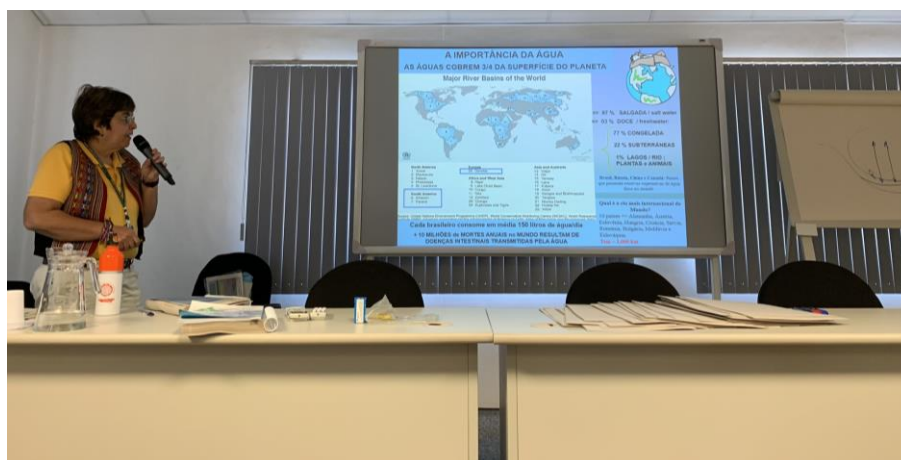
Figura 5. La Dra. Carmen Vergueiro impartiendo la clase de Redes de Monitoreo de la CETESB, Sao Paulo, Brasil.

Se describió la importancia y la necesidad de caracterizar geográficamente los datos de calidad de agua. Para esto, se entregó a los participantes diferentes mapas del estado de Sao Paulo con los resultados de los índices de calidad calculados por la CETESB en cada punto de muestreo.