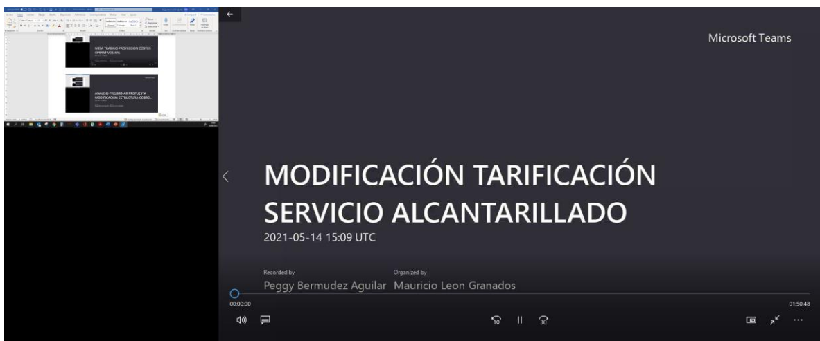
Anexo n°1. Evidencia de invitación a taller