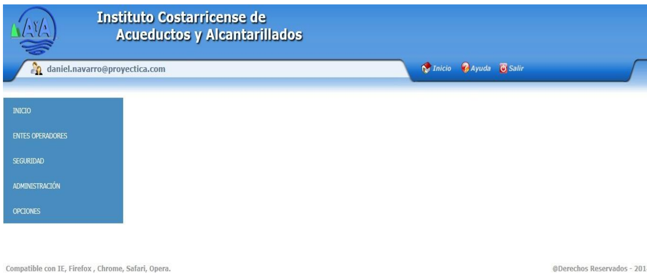
Ilustración 3: Pantalla de Inicio

Al presionar “Entrar”, se ingresa a la pantalla principal del sistema